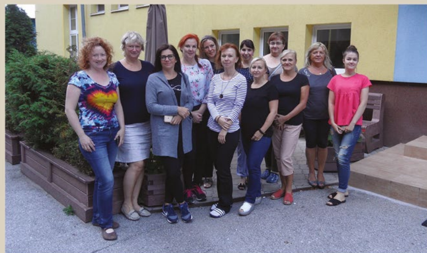
Účastníčky medzinárodného workshopu